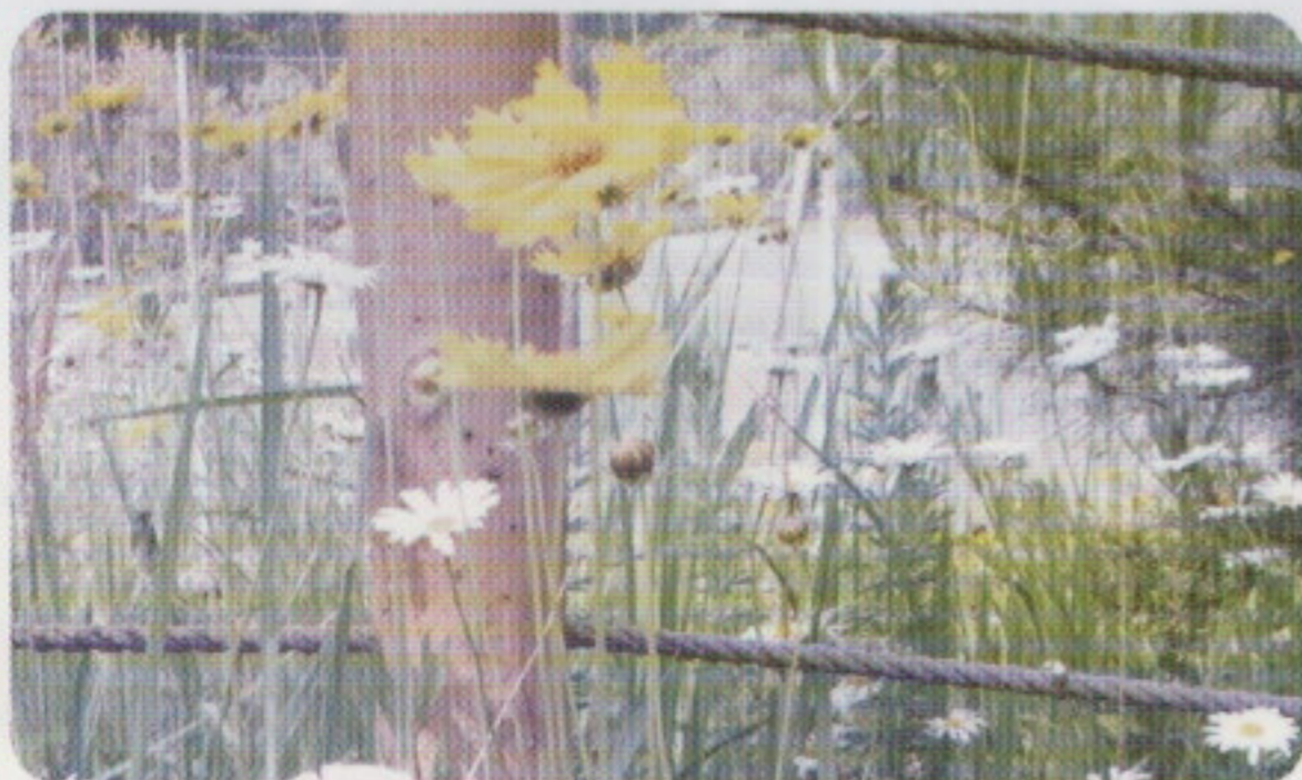
6月に1回目の刈り取り