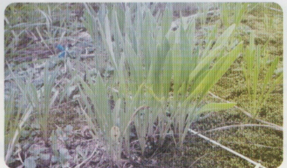
8月に2回目の刈り取り

6・8月の2回刈り取りを数年間行うことにより、ほとんどのオオキンケイギクを駆除することができます。